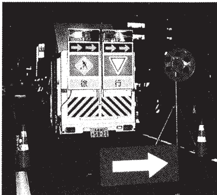
【夜間使用例】 視認性の高い電工標示板